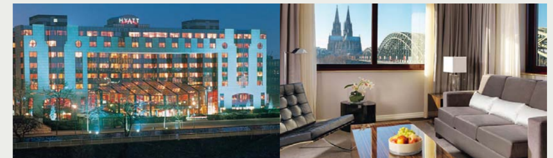
Tagen und entspannen im Hyatt Regency Köln: Großzügige, modern ausgestattete Zimmer und Suiten in edlem Design bieten herrliche Ausblicke auf den Rhein, die Altstadt und den weltberühmten Kölner Dom.

würdigkeiten der Domstadt warten direkt gegenüber auf der anderen Rheinseite. So genießen Teilnehmer aus ganz Deutschland und Russland eine unkomplizierte Anreise und einen angenehmen Aufenthalt.