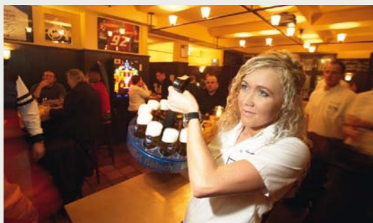
Gesellige Abende erlebt man in der kölnen Altstadt in einem der vielen Brauhäuser.

SUMMEX 2012 haben wir die Stadt Köln als Veranstaltungsort ausgewählt. Gut erreichbar für Teilnehmer und Referenten. Hochattraktiv für jeden Besucher. Und inspirierend als Umfeld für gute Gespräche.